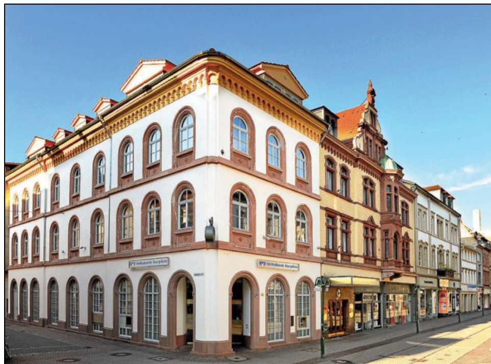
Die Hauptstelle der Volksbank Kurpfalz wird im zweiten Halbjahr komplett renoviert. erst im Jahr 2021 ist die Wiedereröffnung geplant.

Alles in allem zeigt sich die Volksbank Kurpfalz von der Krise aber noch vergleichsweise unbeeindruckt. Es gebe weder Kurzarbeit noch sei ein Personalabbau geplant, sagte Hoffmann. Allenfalls bei frei werdenden Stellen prüfe man genau, ob auf eine Neubesetzung auch verzichtet werden könne. Festhalten werde man auch am geplanten Umbau der Hauptstelle in der Heidelberger Altstadt. Damit werde man voraussichtlich im Sommer beginnen, so Hoffmann. Für Anfang 2021 plane man dann die Wiedereröffnung.